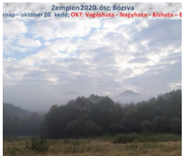
Zemplén 2020. ősz; Bózsva nap – október 20. kedd; OKT: Vágáshuta – Nagyhuta – Kishuta – F ős távolban két hegycsúcs bújik ki sejtelmesen a felhők l