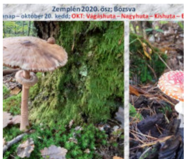
Zemplén 2020. ősz; Bózsva nap – október 20. kedd; OKT: Vágáshuta – Nagyhuta – Kishuta – F kőjárásnak köszönhetően, mindenütt gomba, gomba hátán, DE! Vigyázz (gomba) szakértő. Jobbra például a híres, hírhedt tégelyő gabóca” a „ma