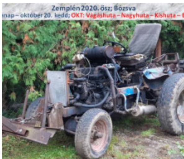
Zemplén 2020. ősz; Bózsva nap – október 20. kedd; OKT: Vágáshuta – Nagyhuta – Kishuta – F

gél félnyolckor már megerkeztünk a kiindulóponttra, Vágáshuta község t a mobil applkáció, majd a túra végén megtudjuk a pontos lépésszám