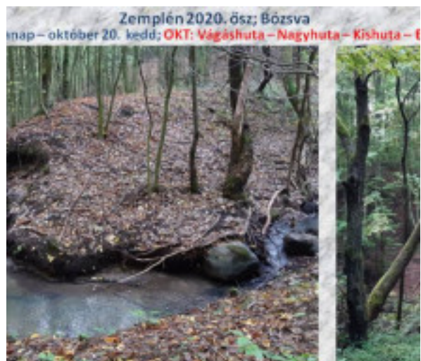
Zemplén 2020. ősz; Bózsva nap – október 20. kedd; OKT: Vágáshuta – Nagyhuta – Kishuta – F látnak, utunkat kíséri egy darabon. Majd ládát látr a leszünk figyelmes esen – magukra hagyják ezeket, legyenek táplálékai sok hasznos bogárn