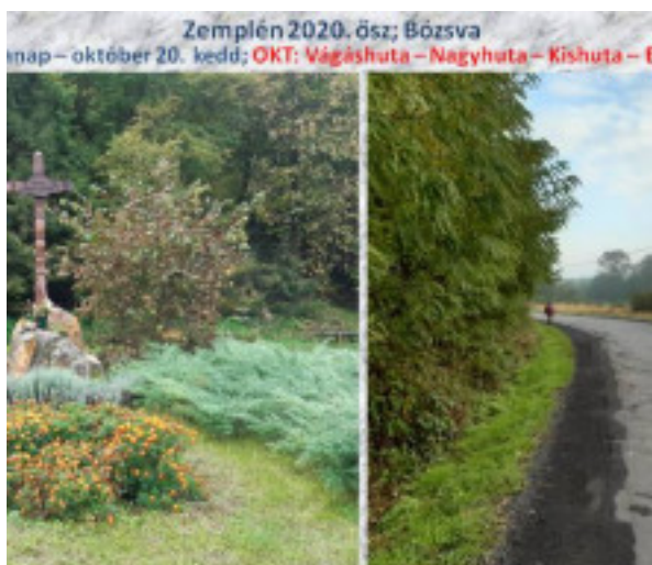
Zemplén 2020. ősz; Bózsva nap – október 20. kedd; OKT: Vágáshuta – Nagyhuta – Kishuta – F

o parkol a kerítés mellett, vajon mire lehet ezt még hasz tőleg majd nem az erdő egy elhagyott sarkában lesz vég