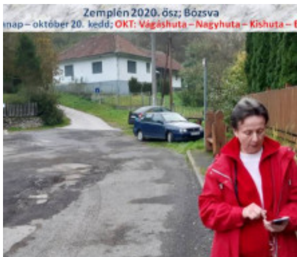
Zemplén 2020. ősz; Bózsva nap – október 20. kedd; OKT: Vágáshuta – Nagyhuta – Kishuta – F

gél félnyolckor már megerkeztünk a kiindulóponttra, Vágáshuta község t a mobil applkáció, majd a túra végén megtudjuk a pontos lépésszám